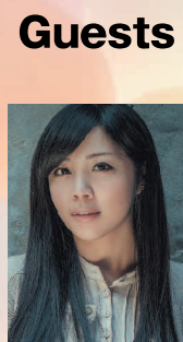
田 葱 (pipa/gt)